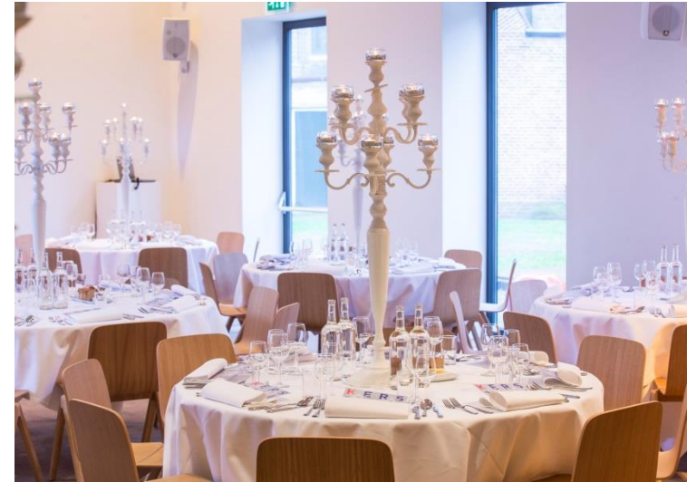
DINER IN TUINZAAL