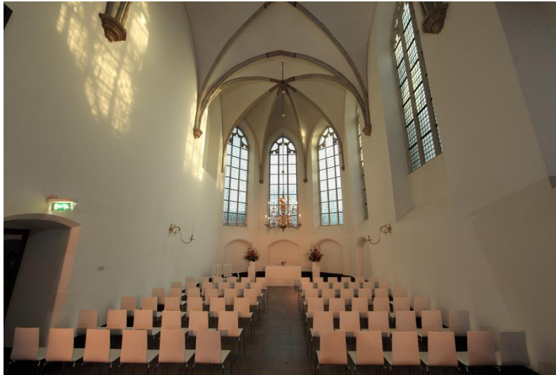
CEREMONIE IN NICOLAÏKERK