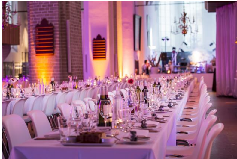
DINER IN NICOLAÏKERK